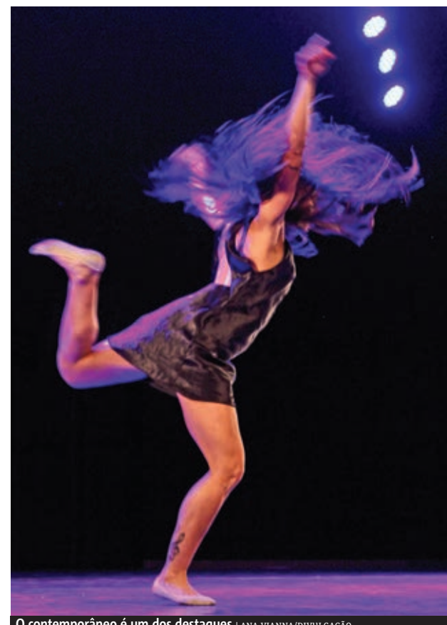
O contemporâneo é um dos destaques